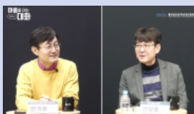
마음을 여는 대화: 대전정보문화산업진흥원 편