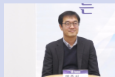
마음을 여는 대화: (주)아이와즈 편