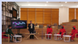
우리들의 마음을 사로잡는 토크: 대전테크노파크편